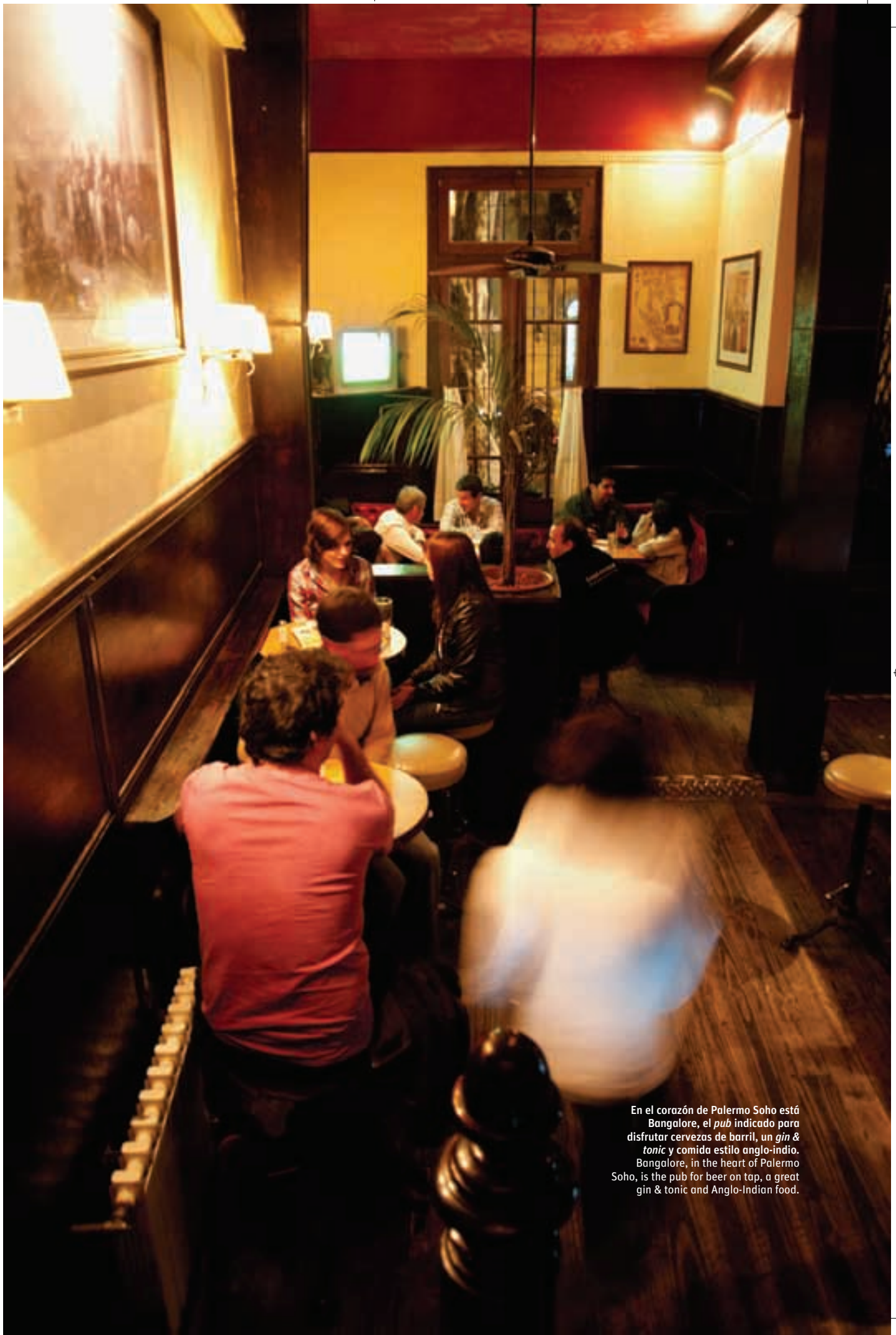
En el corazón de Palermo Soho está Bangalore, el pub indicado para disfrutar cervezas de barril, un gin & tonic y comida estilo anglo-indio. Bangalore, in the heart of Palermo Soho, is the pub for beer on tap, a great gin & tonic and Anglo-Indian food.