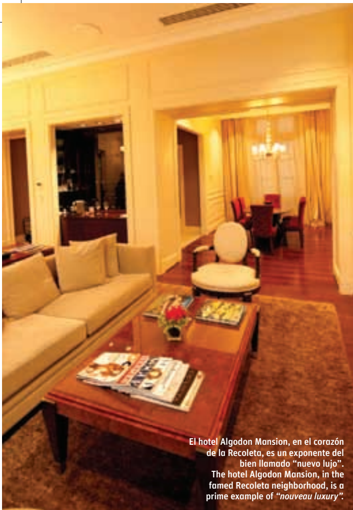
El hotel Algodon Mansion, en el corazón de la Recoleta, es un exponente del bien llamado “nuevo lujo”. The hotel Algodon Mansion, in the famed Recoleta neighborhood, is a prime example of “nouveau luxury”.