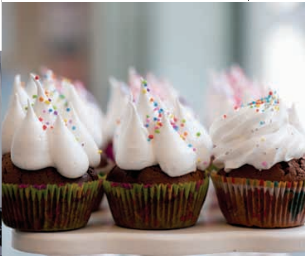
La especialidad de Muma's es el cupcake Gauchito, con base de brownie , dulce de leche y merengue italiano. Muma's cupcake specialty is the Gauchito, with a brownie base, dulce de leche creamy caramel and Italian frosting.